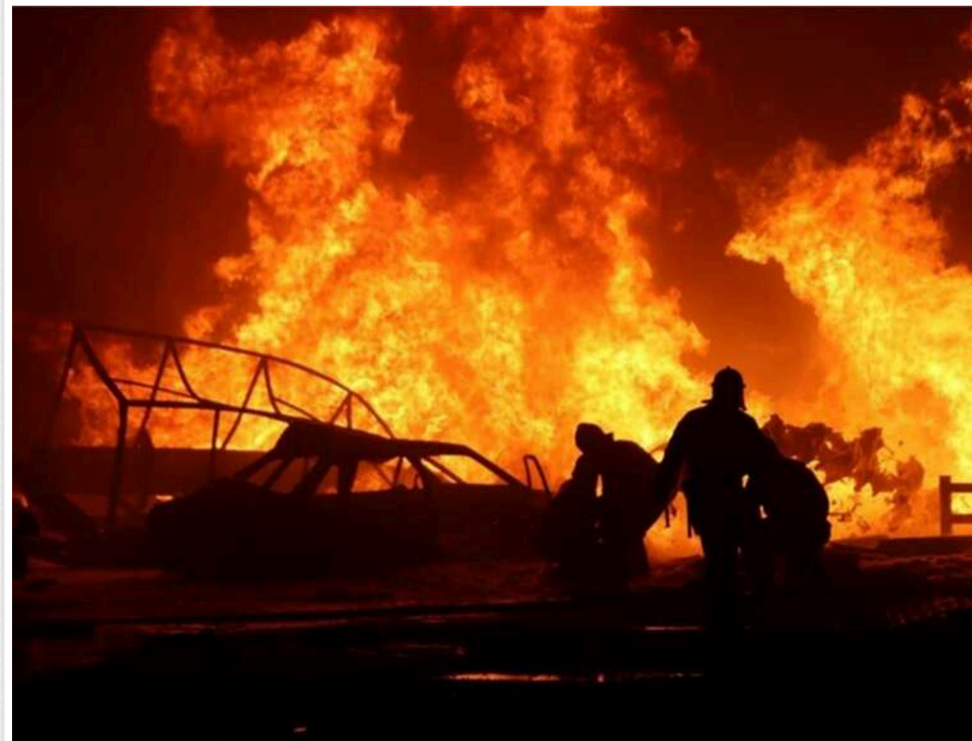
Розгерметизація труби: влада Дагестану назвала техногенну причину вибуху на газопроводі в Кизилюрті

Вибух і пожежа на магістральному газопроводі в російському Дагестані стали результатом техногенної аварії, повідомляють місцеві пабліки.