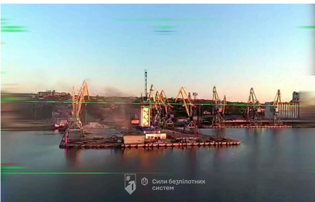
Фото: Скріншот Порт Маріуполя у прицілі дрона

Тепер можливості противника використовувати Маріуполь як логістичний вузол суттєво обмежені.