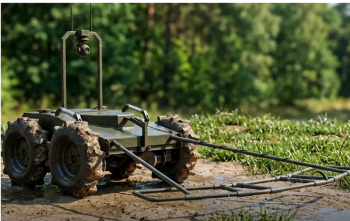
Український робот-сапер NEO-1

Платформа розганяється до 7 км/год., ємності акумуляторів вистачає на вісім годин автономної роботи.