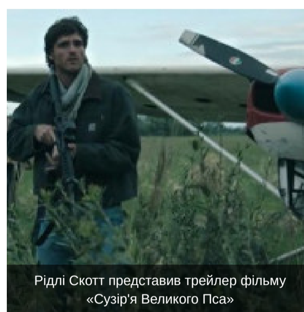
Фото та Відео

Рідлі Скотт представив трейлер фільму «Сузір'я Великого Пса»