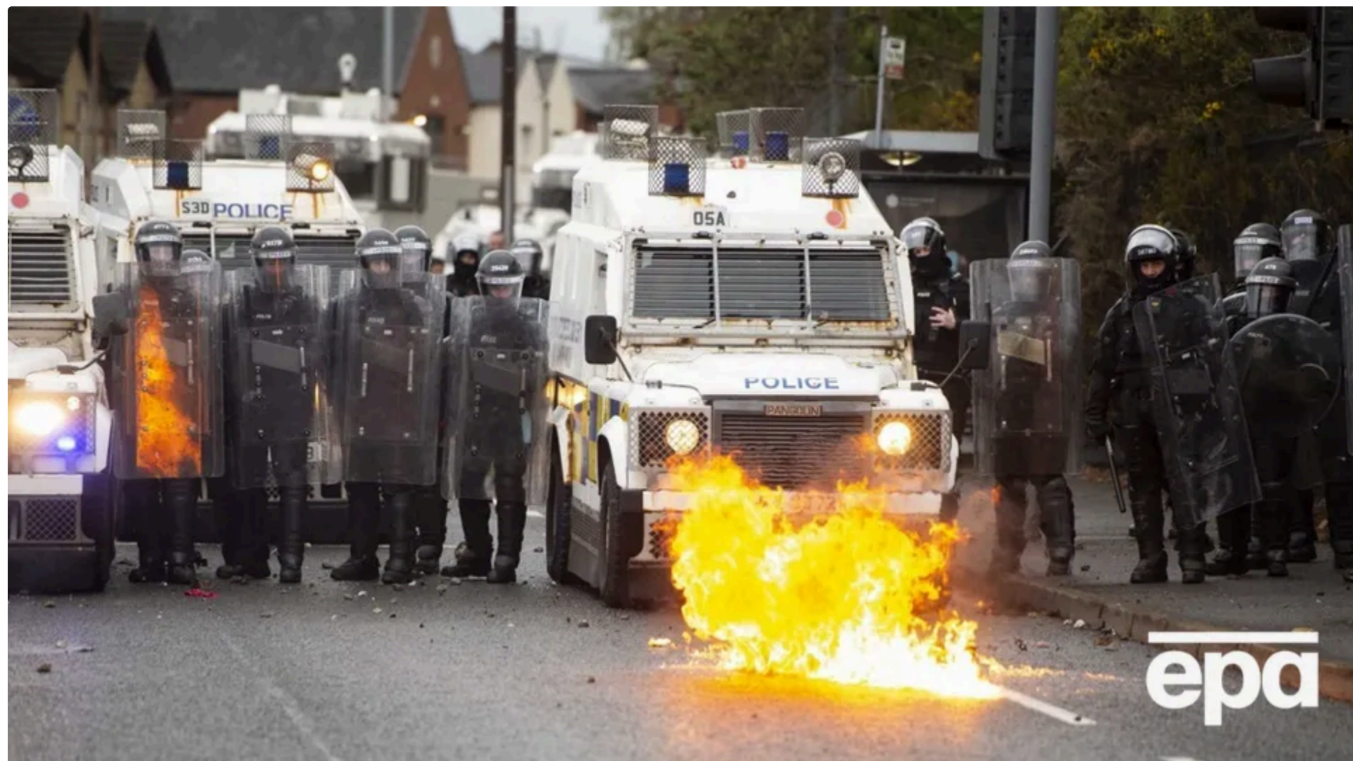
У столиці зупинили весь громадський транспорт внаслідок протестів

У Белфасті, столиці Північної Ірландії, після нападу з ножем, який стався увечері 8 червня, спалахнули заворушення й погроми: люди в масках підпалювали будинки, авто й автобуси. Насильницькі протести також фіксували в п'яти інших містах, повідомило 10 червня BBC .