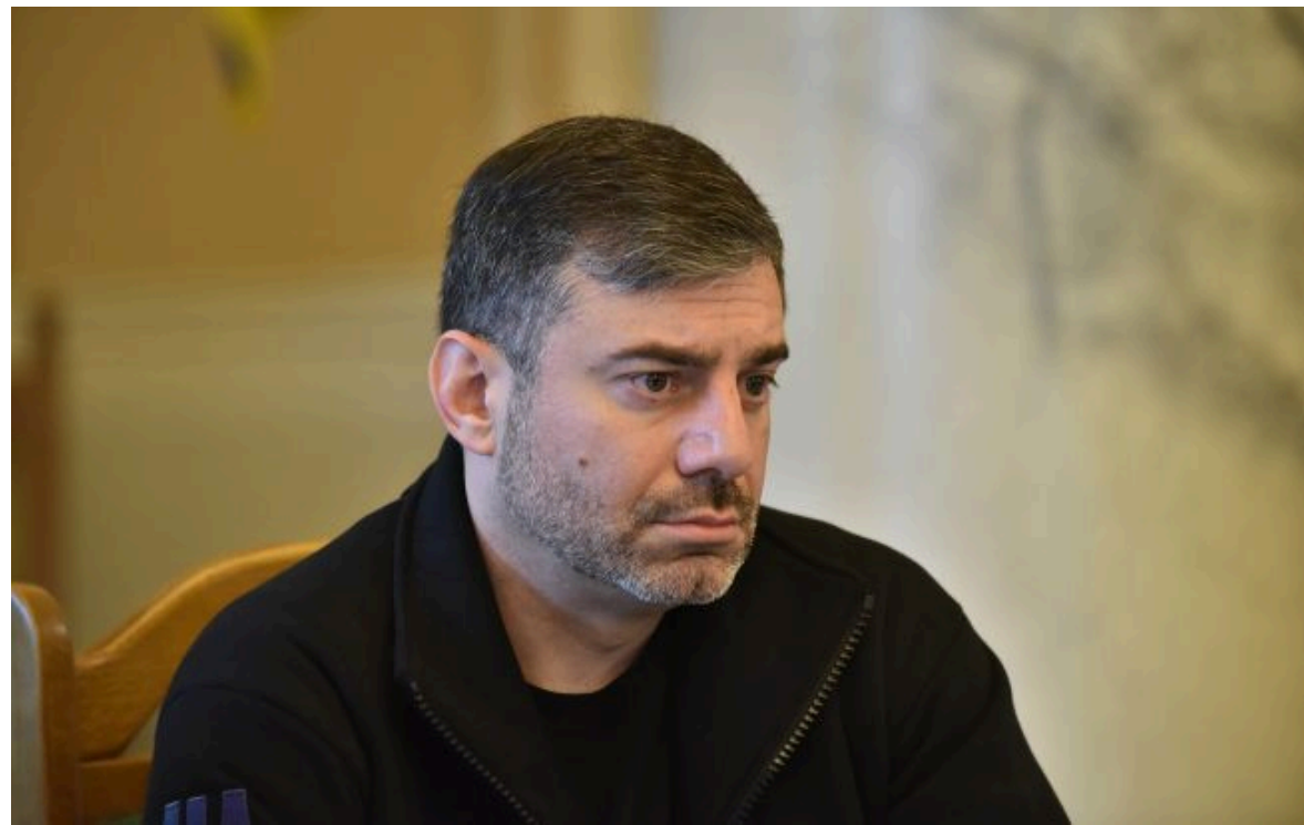
Фото: Уповноважений Верховної Ради України з прав людини Дмитро Лубінець