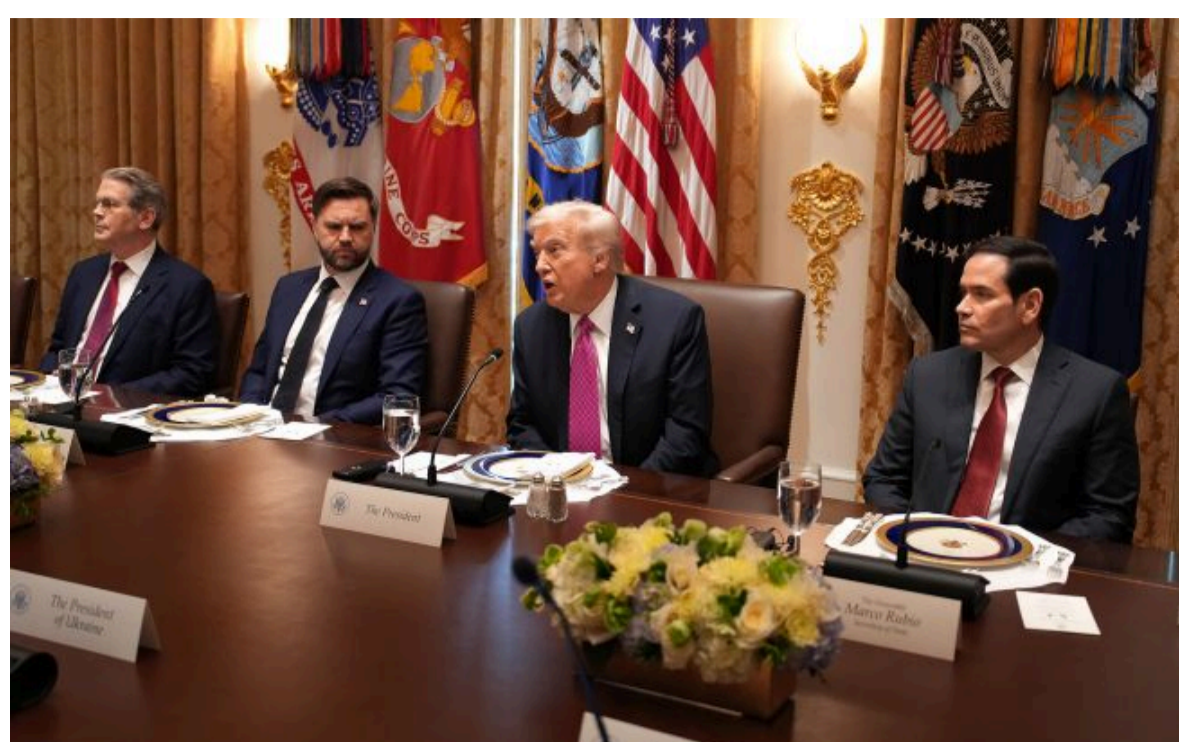
Фото: Дональд Трамп, Марко Рубіо, Джей Ді Венс та Скотт Бессент (Getty Images)

Вимки хаос міжнародних новин! Отримуй тільки важливе з РБК-Україна у Google