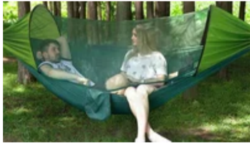
Гамак на 2 людини: сітка проти камарів, надійні кріплення