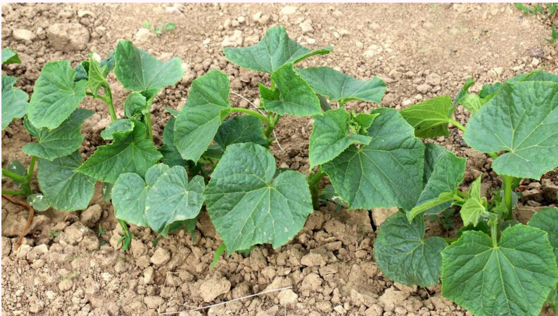
За словами городниці, йод стимулює утворення нових зав'язей

10 червня, 10:10 🗨️ Цей матеріал також можна прочитати на русском