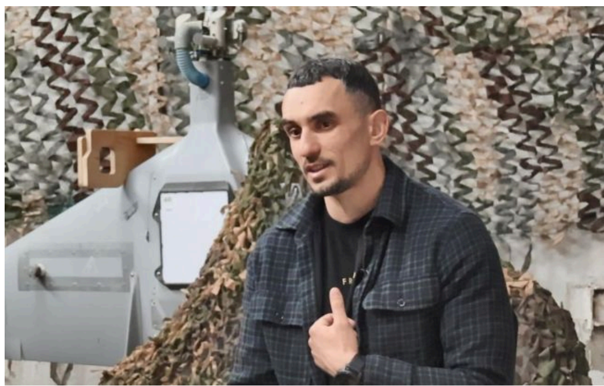
Боєць "Джаконда"