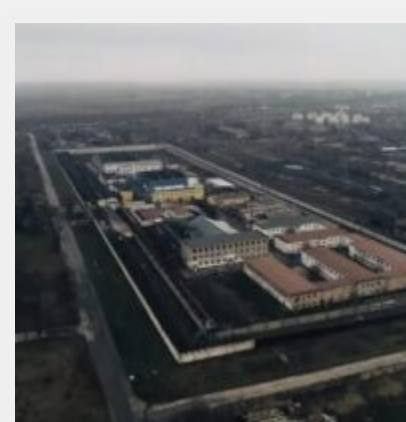
Російські загарбники перетворили Бердянську колонію № 77 на катівню для українців