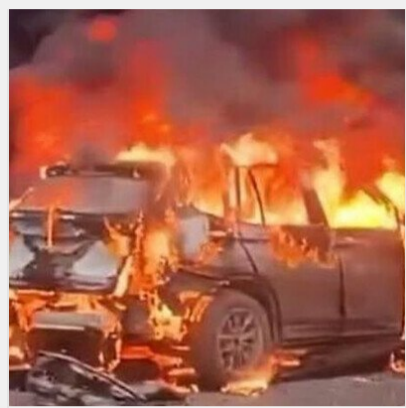
У Москві вибухнув автомобіль з генерал-лейтенантом