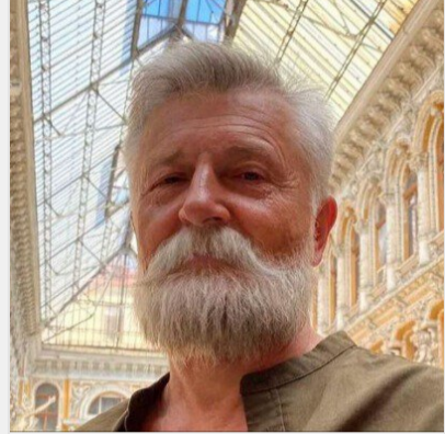
Зеленський відвідував його у "в'язниці". Куди зникла зірка ..