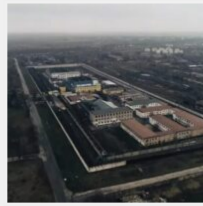
Російські загарбники перетворили Бердянську колонію № 77 на катівню для українців