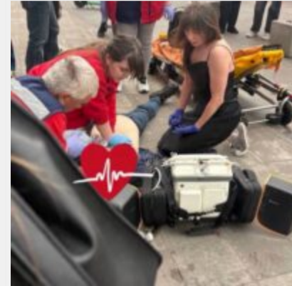
«А МИ ТУТ ПРИ ЧОМУ?». Смертельна відмова за п'ять хвилин від порятунку та ціна байдужості київської підземки