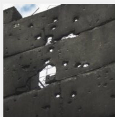
Як виглядає українська ТЕЦ, що пережила не одну ракетну атаку російських загарбників