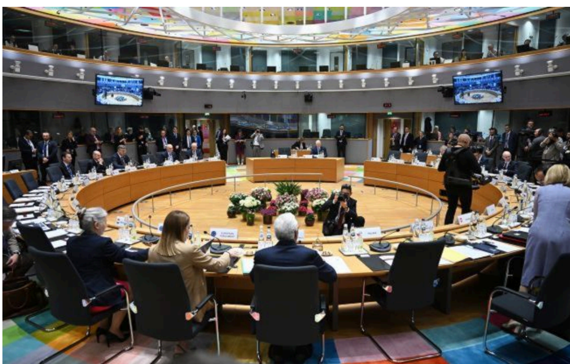
Фото: п'ять країн ЄС хочуть урізати права нових членів після вступу до блоку

Вимкни хаос міжнародних новин! Отримуй тільки важливе з РБК-Україна у Google