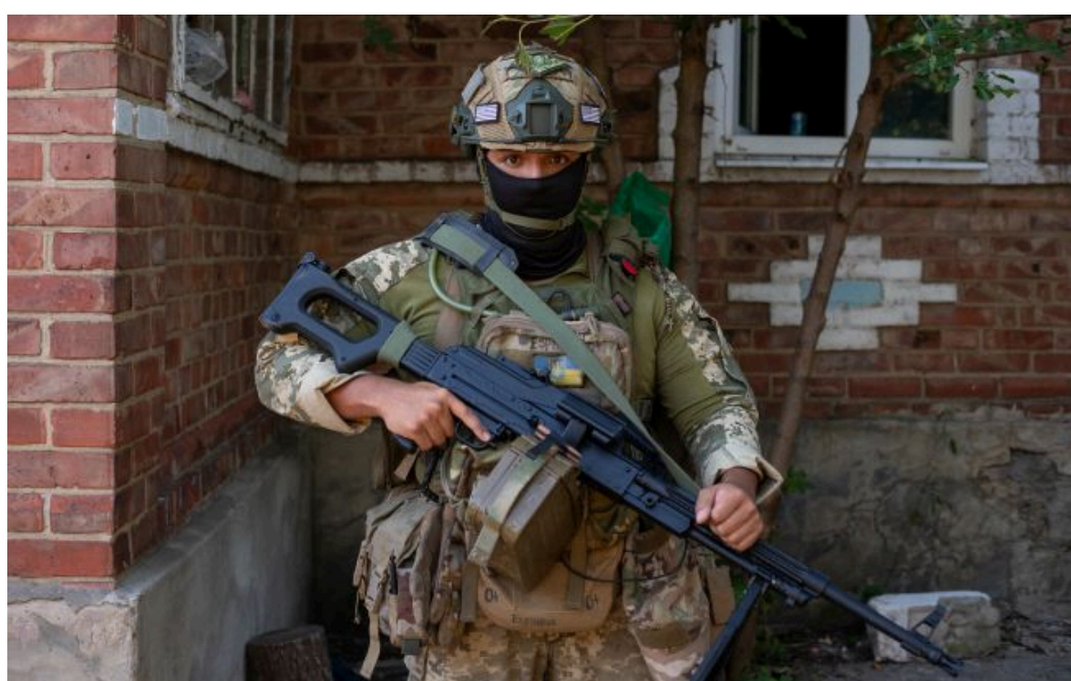
Фото: ЗСУ просунулися на двох напрямках