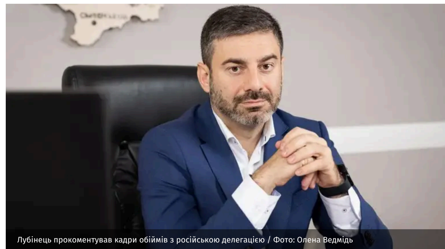
Лубінець прокоментував кадри обіймів з російською делегацією

У мережі з'явилося відео із зустрічі української сторони з російською омбудсманкою Яною Лантратовою. На кадрах представники делегацій віталися обіймами.