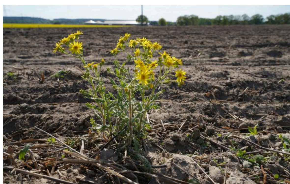
Фото: Посухи стають звичним явищем для України (Getty Images)

Стихія не застане зненацька! Слідкуй за змінами погоди з РБК-Україна у Google