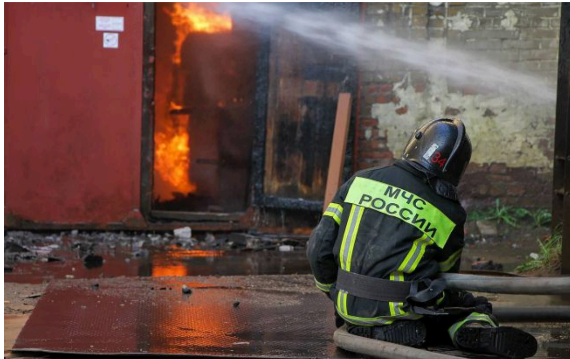
Фото: губернатор підтвердив атаку

Не витрачай час на шум! Читай тільки суть з РБК-Україна у Google