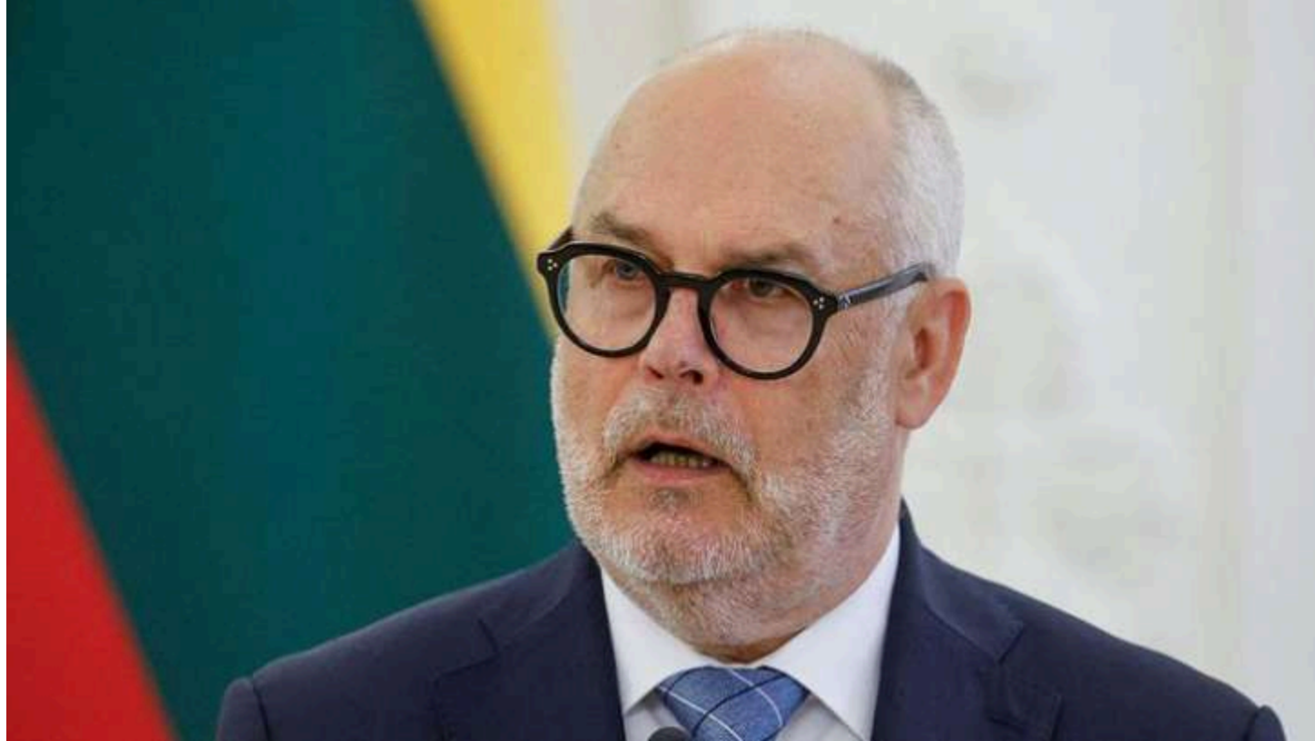
Алар Каріс

Президент Естонії Алар Каріс заявив, що Україна має стати членом Євросоюзу та НАТО. За його словами, європейські рішення й обіцянки щодо України не повинні залишатися лише на папері. Про це Каріс сказав під час спільної пресконференції з президентом України Володимиром Зеленським у Талліні.