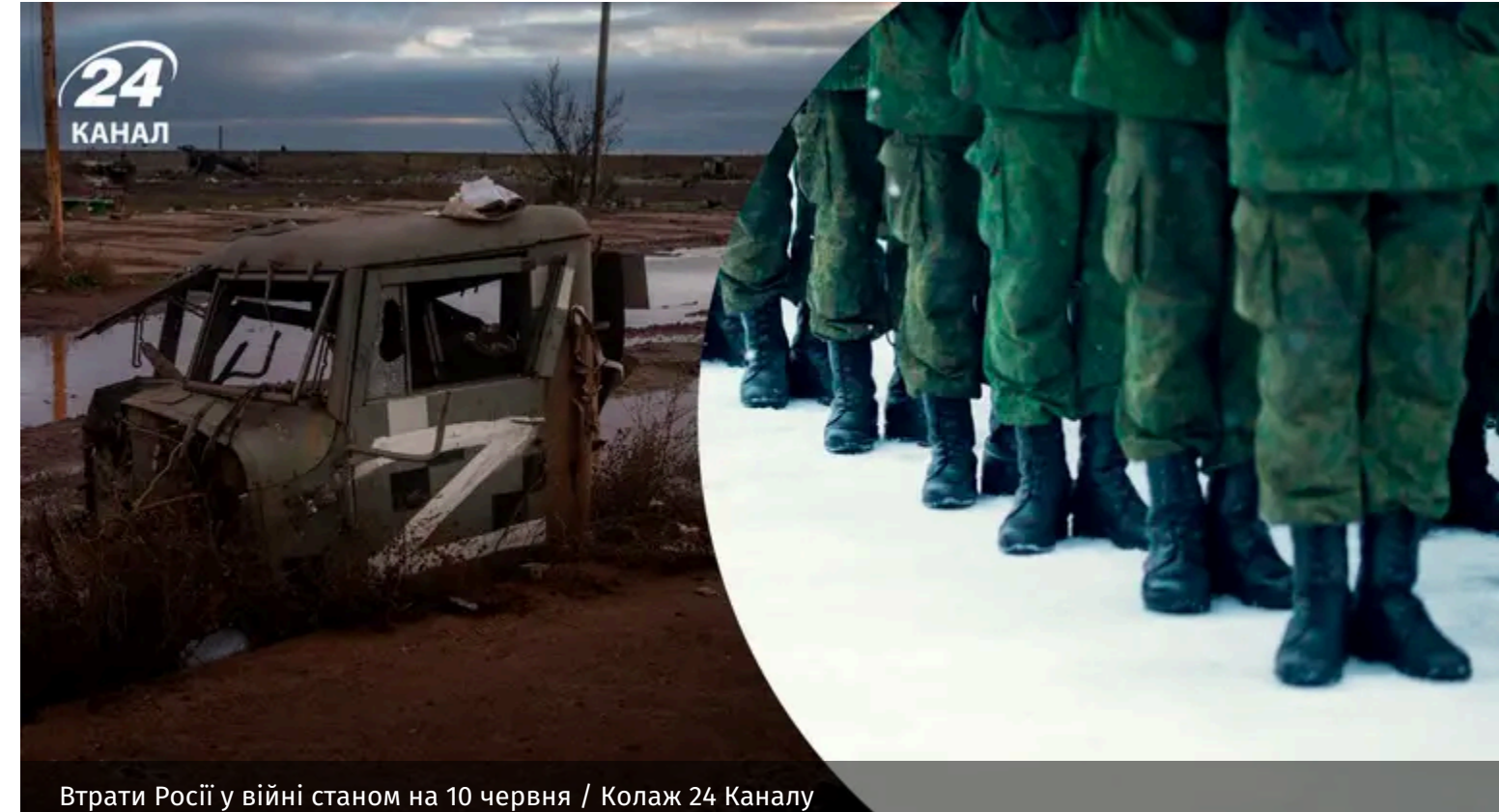
Втрати Росії у війні станом на 10 червня

Українські захисники продовжують стримувати російський наступ на фронті та завдавати ворогу відчутних втрат. Лише за останню добу російська армія втратила сотні військовослужбовців та десятки одиниць техніки.