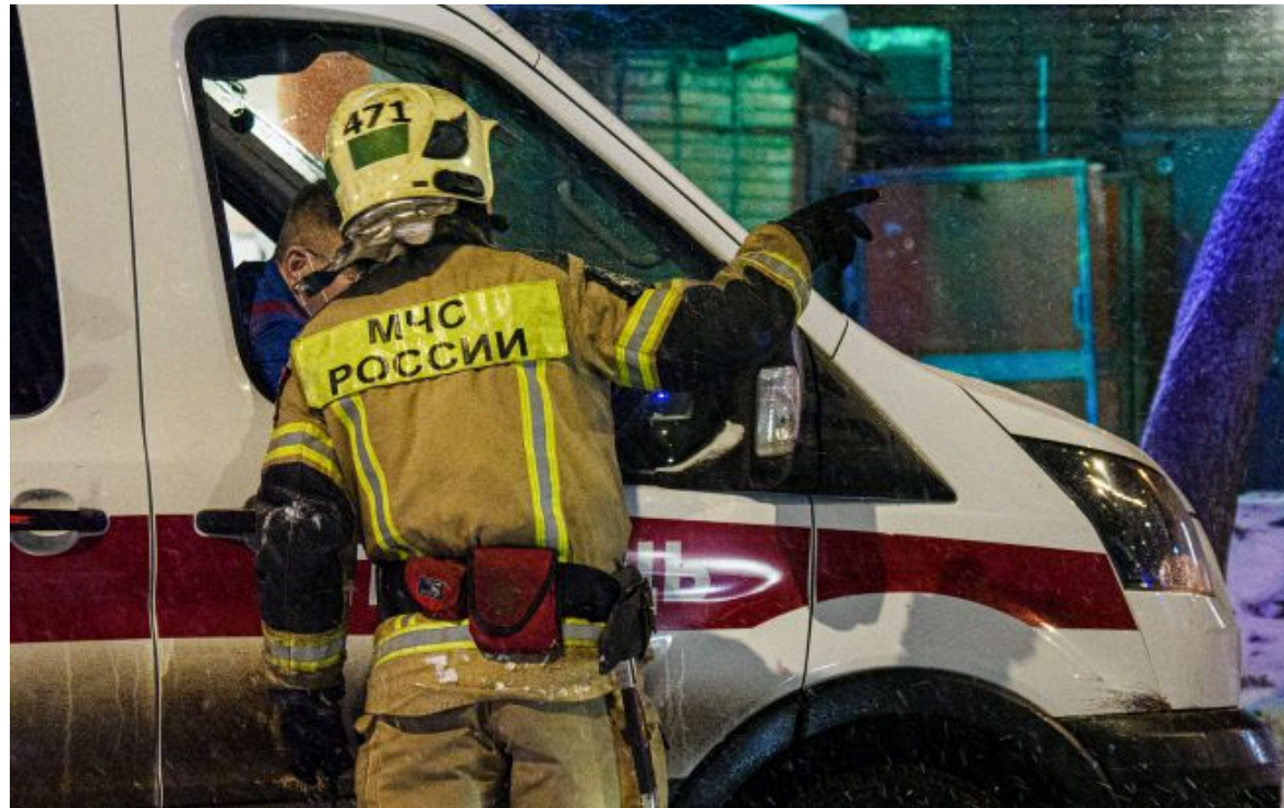
Фото: працівник МЧС на виклику з ліквідації пожежі

Не витрачай час на шум! Читай тільки суть з РБК-Україна у Google