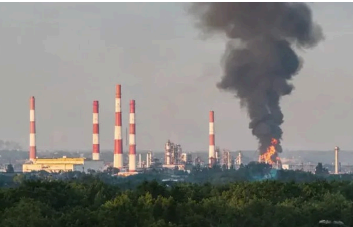
Дрони атакували Новокуйбишевський нафтопереробний завод

Займання відбулося на промисловому майданчику заводу. Стоп чорного диму видно за кілька кілометрів.