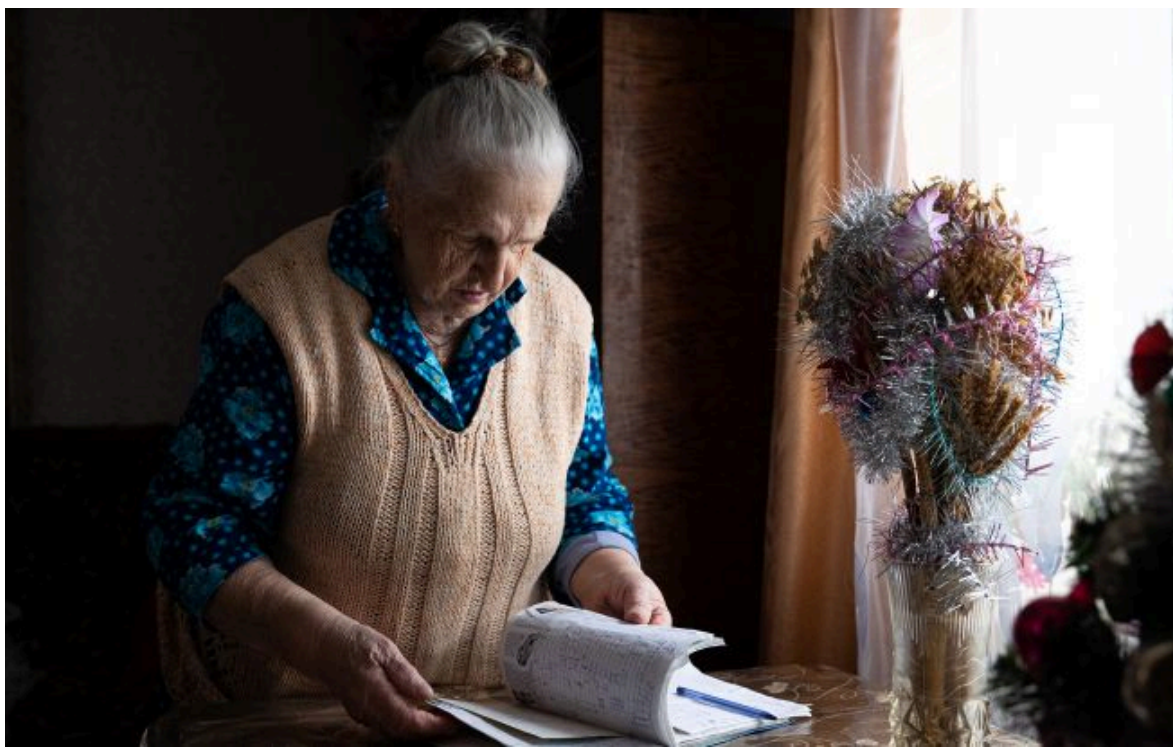
Фото: пенсіонери в РФ змушені працювати задля виживання