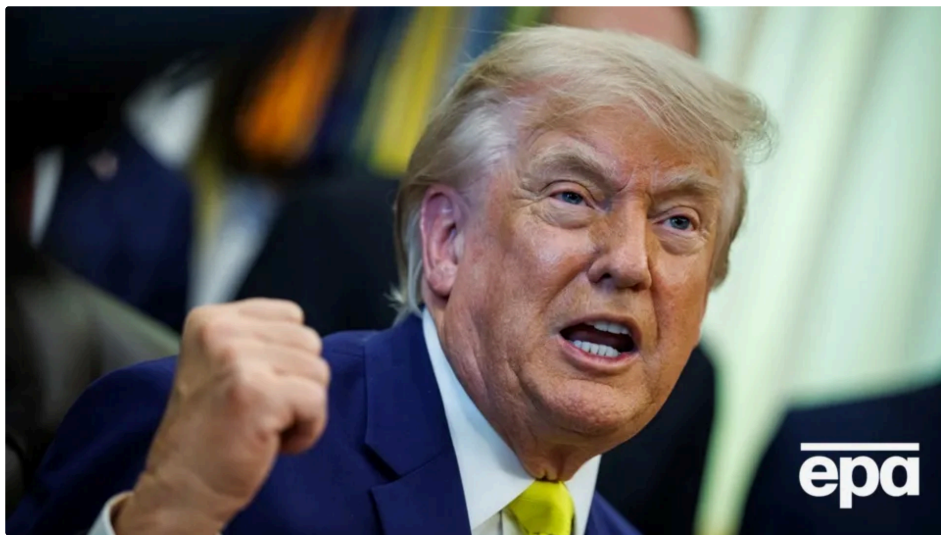
США вдарили по Ірану

10 червня, 01:14 🗨️ Цей матеріал також можна прочитати на руском