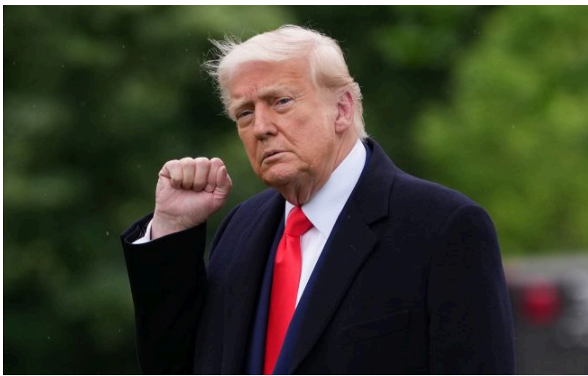
Фото: Дональд Трамп (Getty Images)