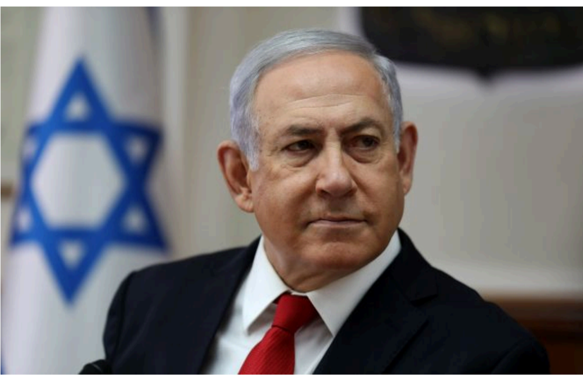
Фото: прем'єр-міністр Ізраїлю Біньямін Нетаньягу