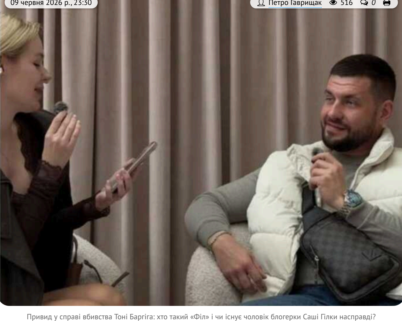
Привид у справі вбивства Тоні Баргіґа: хто такий «Філ» і чи існує чоловік блогерки Саші Гілки насправді?

Вбивство ізраїльського бізнесмена Тоні Баргіґа в Празі стало однією з найзучніших кримінальних історій останніх місяців. Баргіґа називали «королем слот-машин», пов'язували з гральним бізнесом і великими фінансовими потоками. Після вбивства чеська поліція затримала підозрюваного. Але далі почалося дивне.