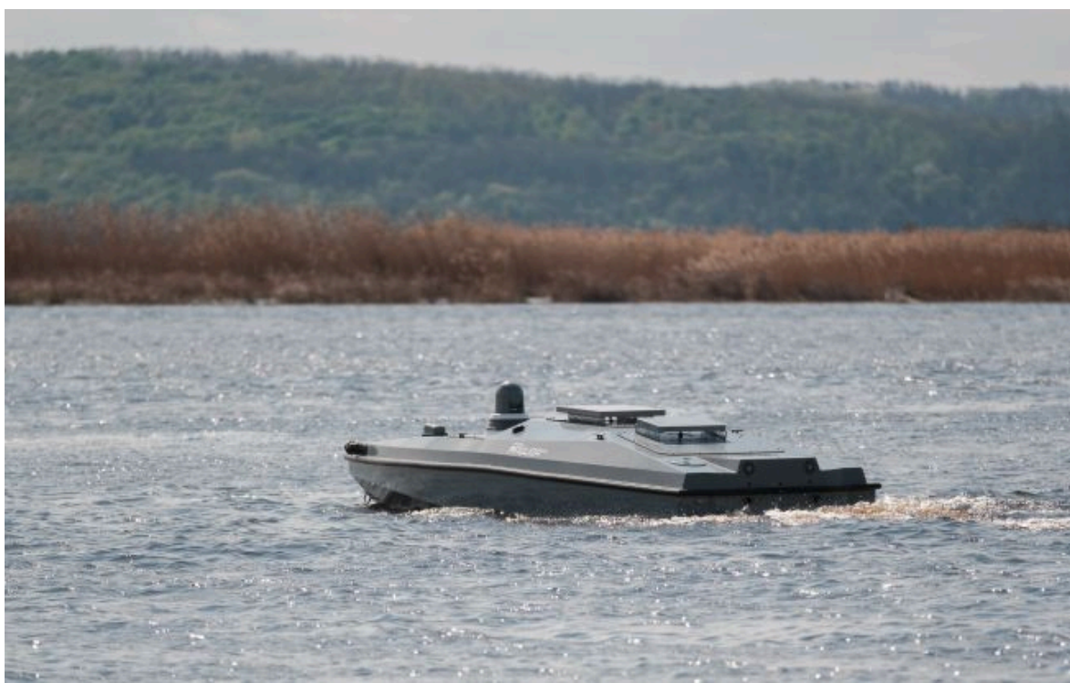
Фото: український морський дрон MAGURA V5