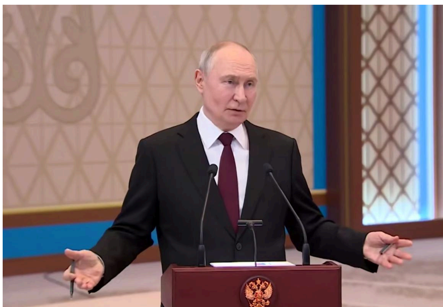
Війна виснажує економіку РФ

Після кількох років санкційного тиску російська економіка зіткнулася з серйозними бюджетними труднощами, але не готова скорочувати бюджети.