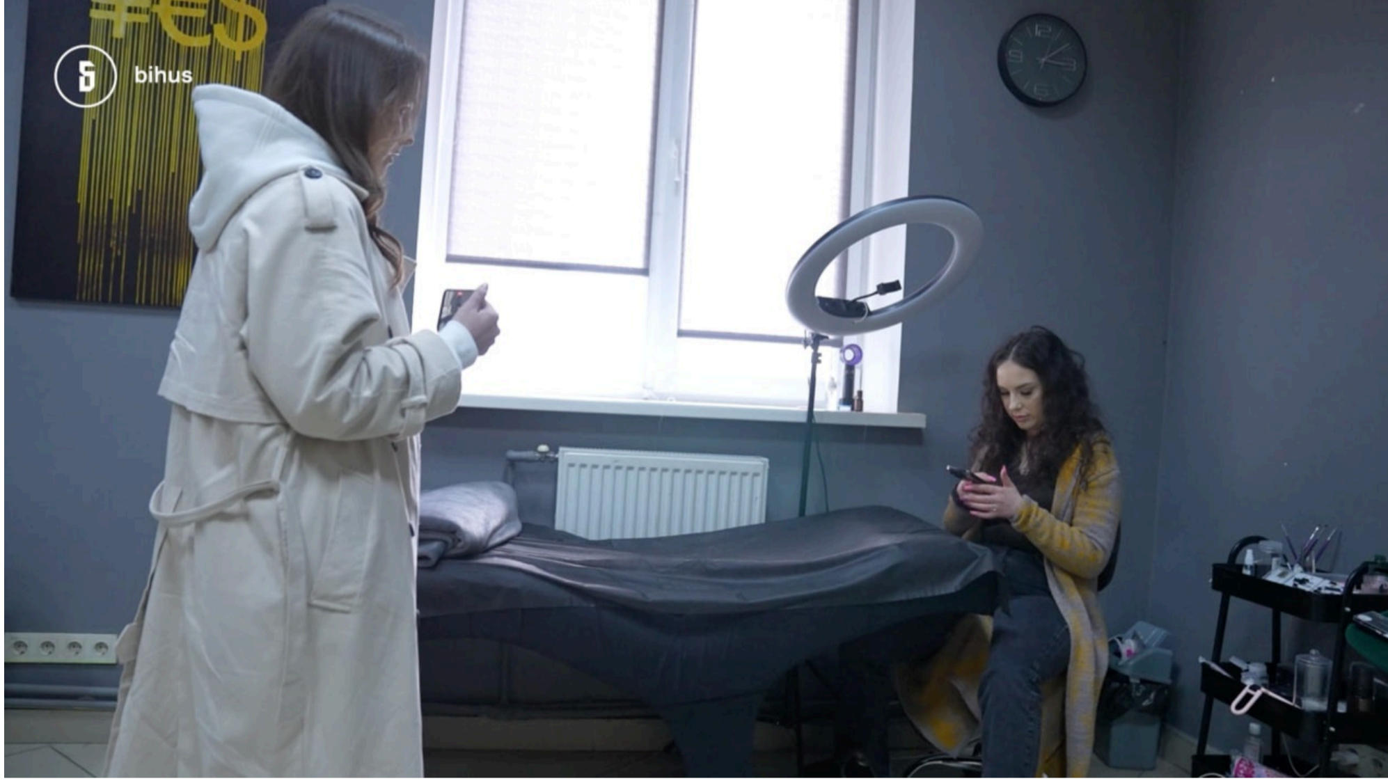
Журналісти у кабінеті beauty-майстрині з Броварів.