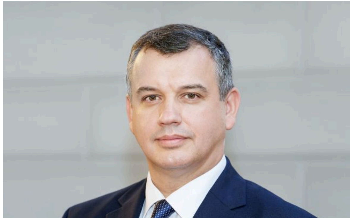
Фото: призначений прем'єр-міністр Румунії Єуджен Томак