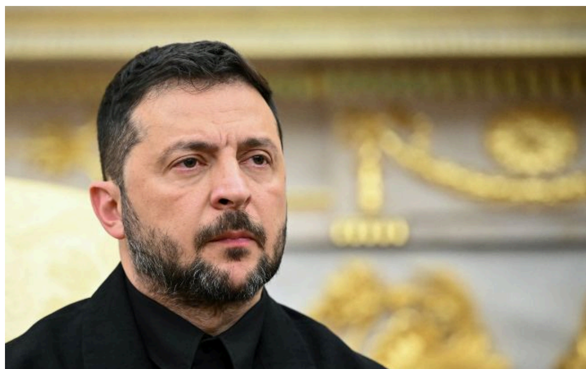
Фото: Володимир Зеленський (Getty Images)