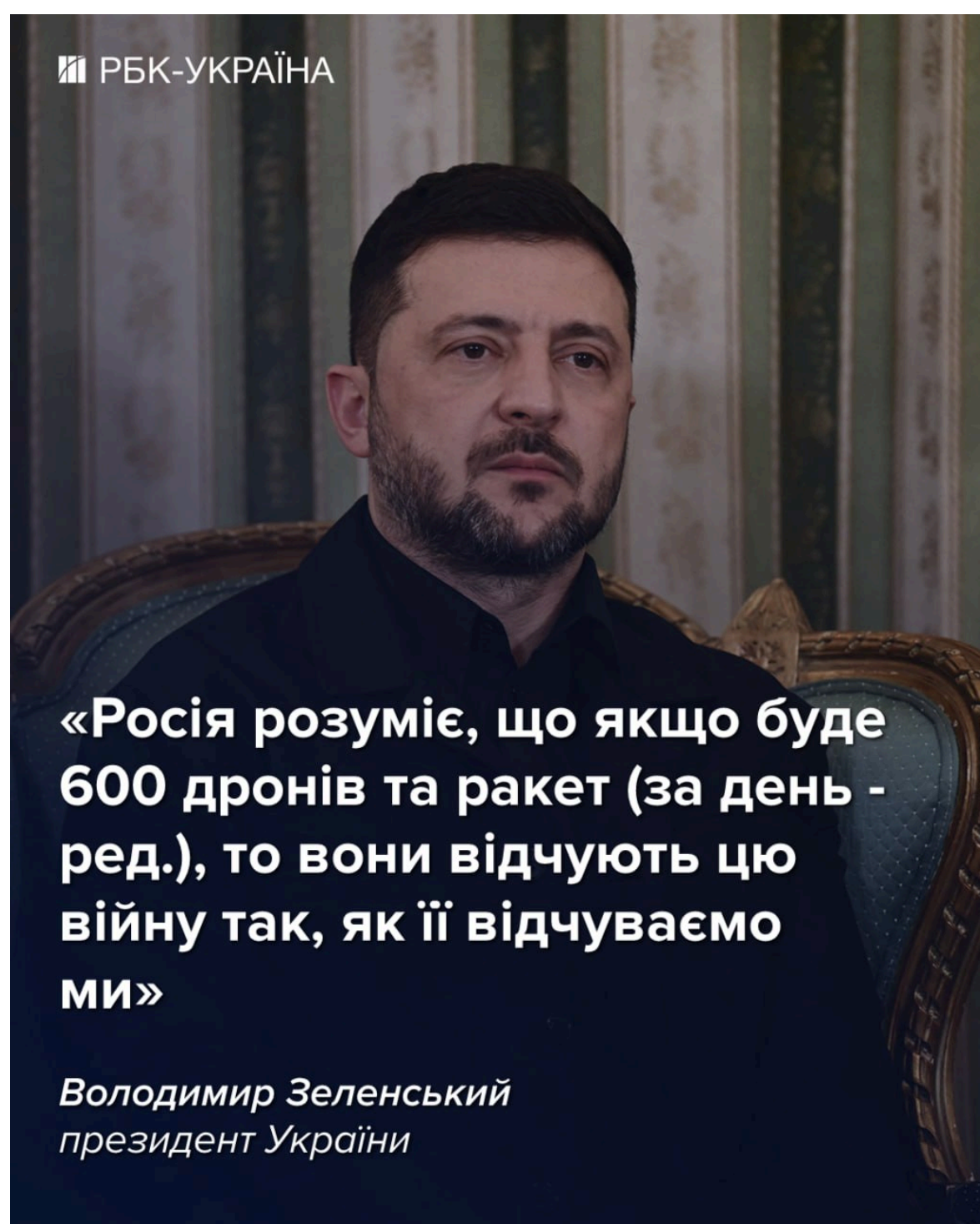
Фото: Зеленський обіцяє збільшення ударів по РФ (інфографіка РБК-Україна)

"Росія розуміє, що якщо буде 600 дронів і ракет (на день, - ред.), то вони відчують цю війну так, як відчуваємо її ми", - наголосив президент.