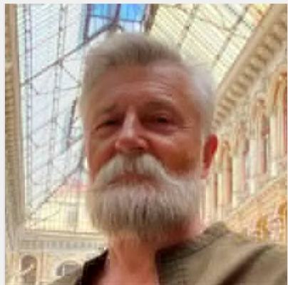
Зеленський відвідував його у "в'язниці". Куди зникла зірка ..