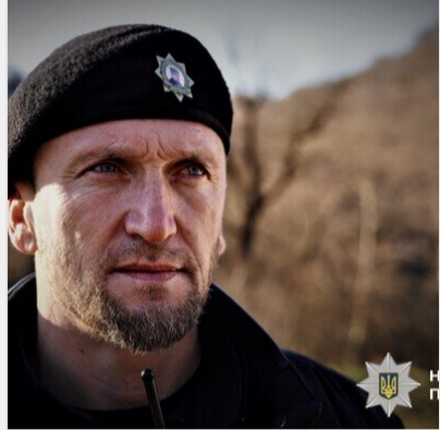
Катував цивільного молотком і імітував страту: поліція ..