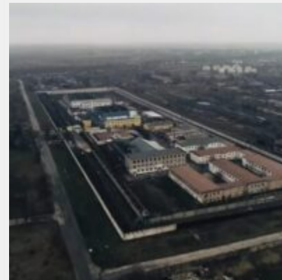
Російські загарбники перетворили Бердiansьку колонію № 77 на катівню для українців