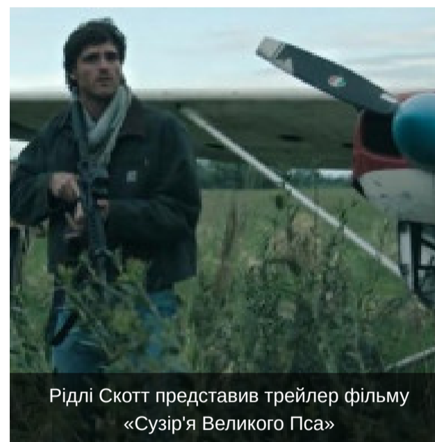
Фото та Відео

Рідлі Скотт представив трейлер фільму «Сузір'я Великого Пса»