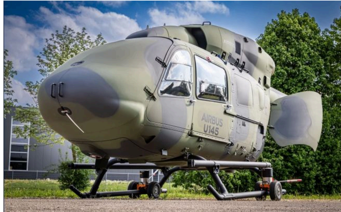
Фото: Airbus створив безпілотний вертоліт