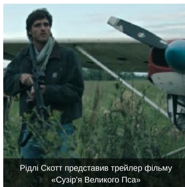
Фото та Відео

Рідлі Скотт представив трейлер фільму «Сузір'я Великого Пса»