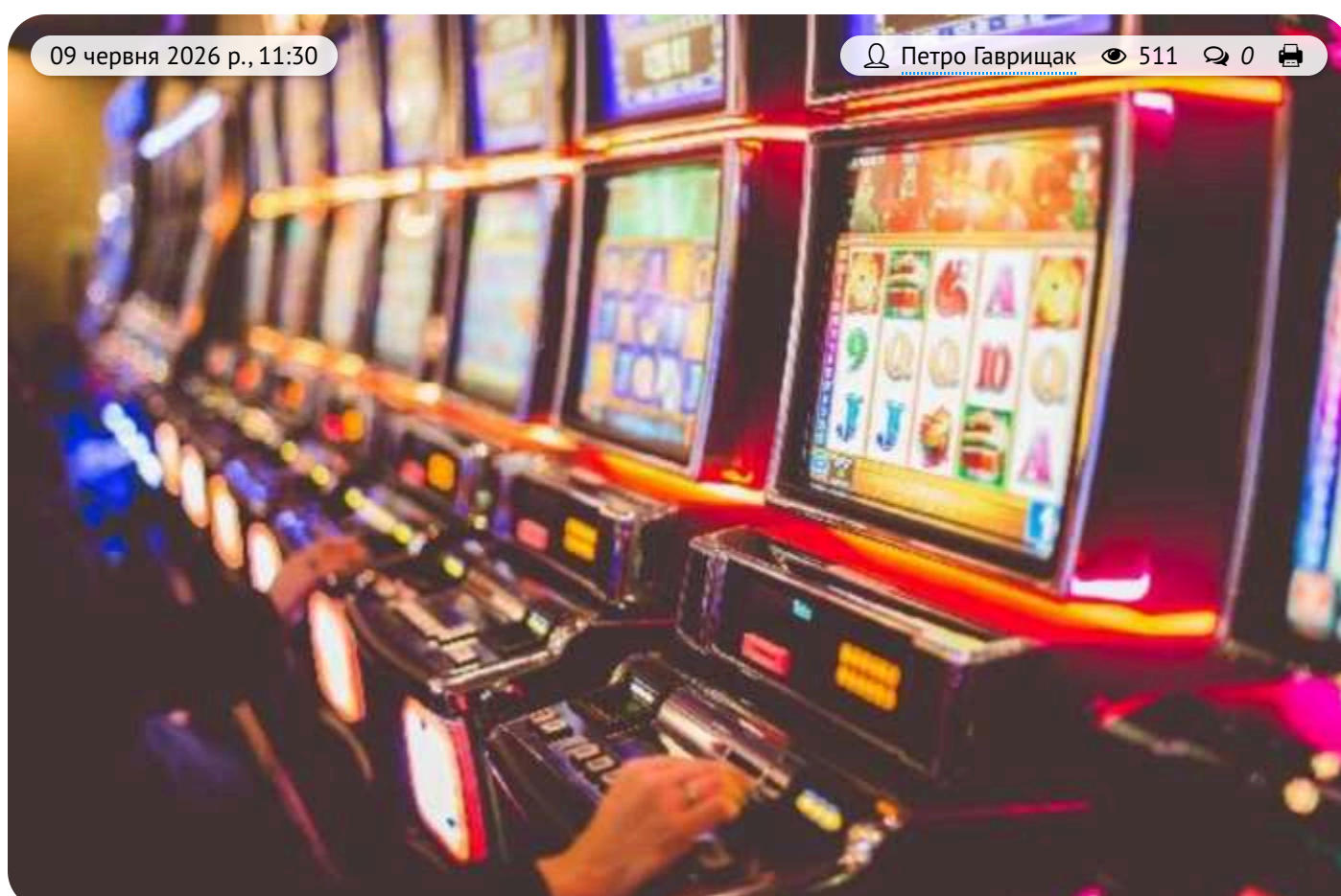
Суд підтвердив арешт 103 мільйонів гривень «Космолоту» Сергія Токарева: у справі фігурують відмивання коштів, хабар СБУ та російський слід

Київський апеляційний суд підтвердив законність арешту 103 мільйонів гривень, що належали компанії «Космолот» і перебували на рахунках в «Сенс Банку». Заходи вжито в межах кримінального провадження, що розслідує діяльність масштабної схеми з легалізації грошових коштів через гемблінг-індустрію.