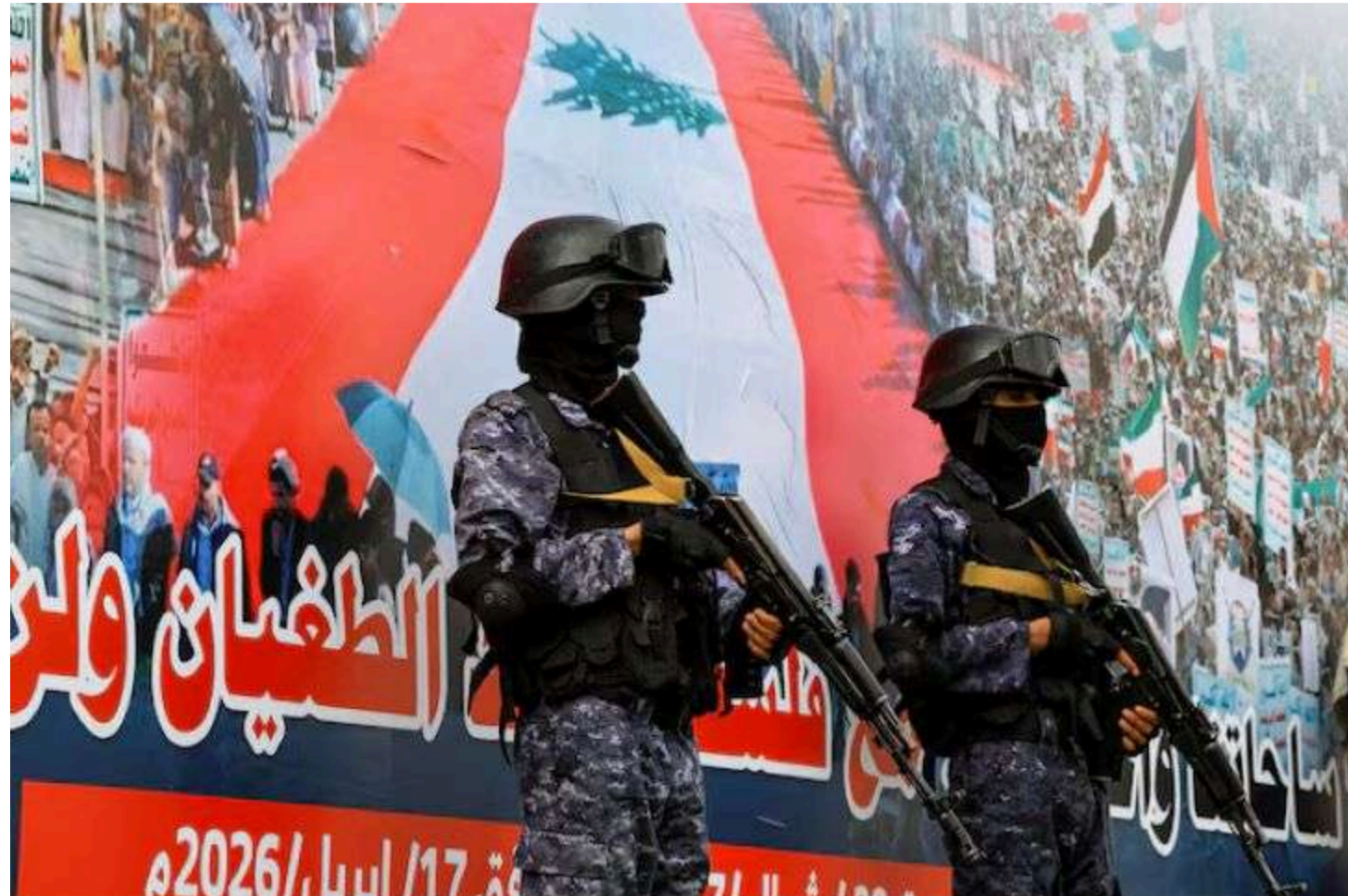
Фото: Співробітники служби безпеки хуситів/REUTERS/Khaled Abdullah

Єменське угруповання хуситів «Ансар Алла» оголосило про заборону на прохід суден, пов'язаних з Ізраїлем, через акваторію Червоного моря. Угруповання заявило, що вважатиме такі судна законними військовими цілями. Про це хусити повідомили у своїх соцмережах.