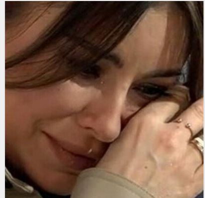
Хотіла всидіти на двох стільцях, а тепер не потрібна ..