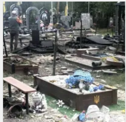
Рука врятувала голову: "шахед розірвався на кладовиці"