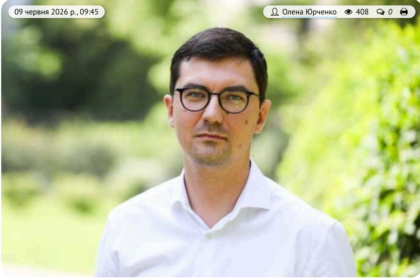
Депутат «Слуги Народу» Андрій Мотовиловець орендує елітну квартиру за ціною втричі нижче ринку через фірму майстрині з нарощування вій

Як повідомляють журналісти, перший заступник голови фракції «Слуга народу» Андрій Мотовиловець із літа 2025 року проживає у 180-метрової квартирі в центрі Києва. Власником житла є фірма, що належить майстрині з нарощування вій з Броварів. Компанія придбала нерухомість вартістю 14 мільйонів гривень через місяць після реєстрації та здала її нардепу за ціною, нижчою за ринкову.