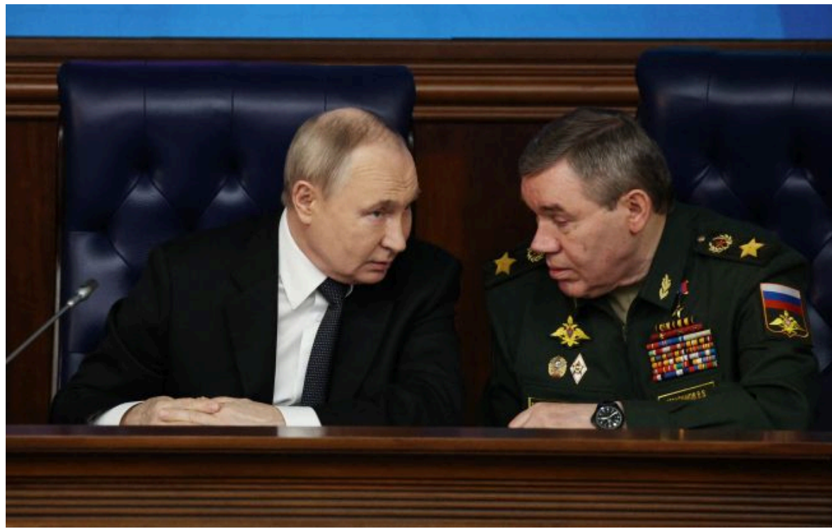
Фото: хазяїн Кремля Володимир Путін та начальник Генштабу РФ Валерій Герасимов