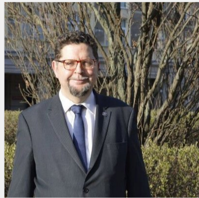
У Польщі розкритивкували чиновника за порівняння УПА з ..