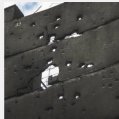
Як виглядає українська ТЕЦ, що пережила не одну ракетну атаку російських загарбників