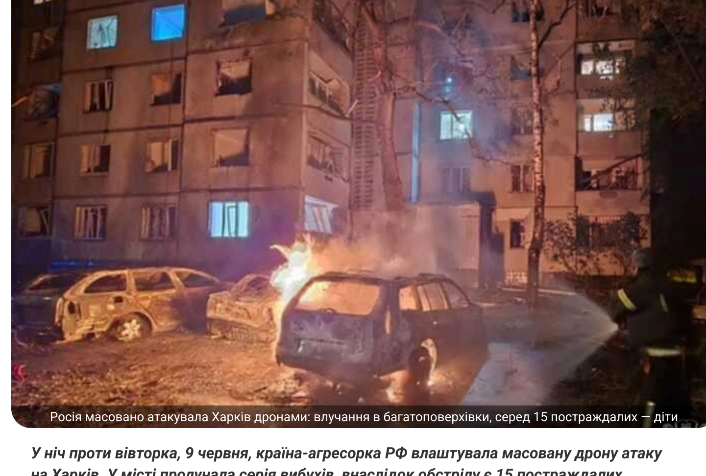
Росія масовано атакувала Харків дронами: влучання в багатоповерхівки, серед 15 постраждалих — діти