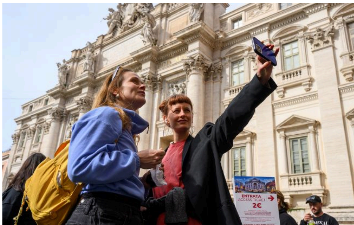
Фото: молода пара робить селфі (Getty Images)