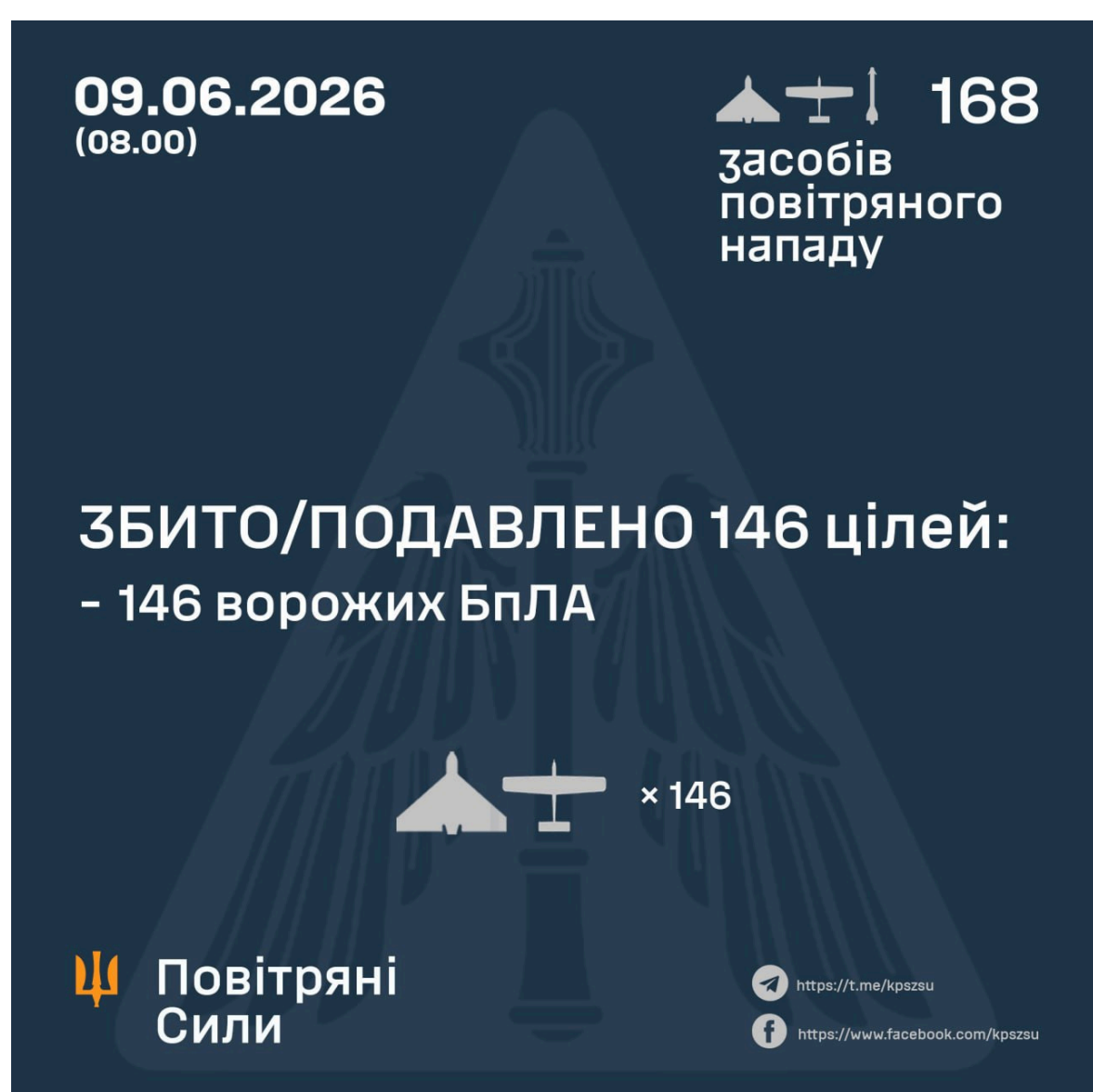
Фото: скільки дронів та ракет випустила по Україні Росія цієї ночі

Запуски здійснювали з Орла, Курська, Брянська, Приморсько-Ахтарська, Міллерово, а також з тимчасово окупованих Донеччини та Криму.