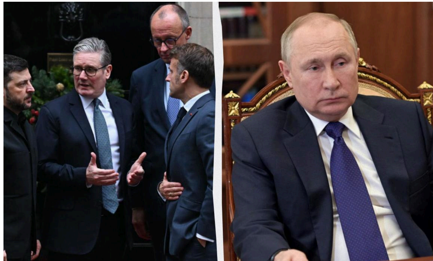
Європа може замінити США

У Німеччині заявили, що готові вести переговори безпосередньо з Путіним.