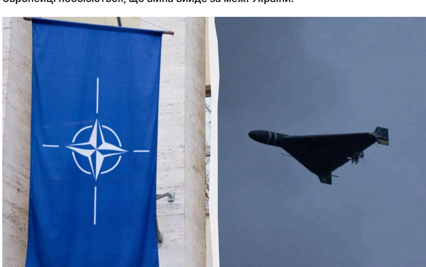
Подібні інциденти тривають

Європейці побоюються, що війна вийде за межі України.