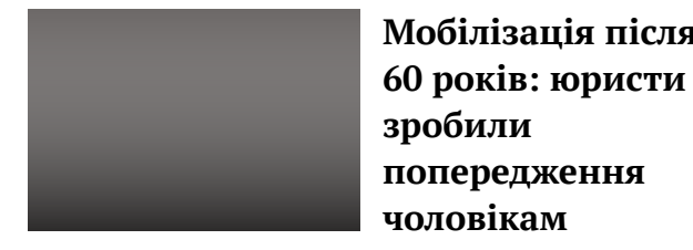
Мобілізація після 60 років: юристи зробили попередження чоловікам