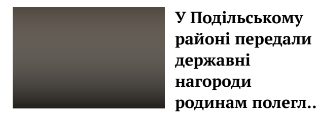
У Подільському районі передали державні нагороди родинам полегл...