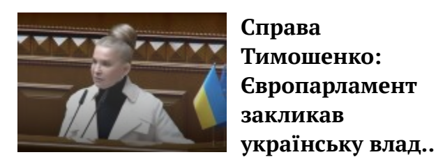
Справа Тимошенко: Європарламент закликав українську влад...