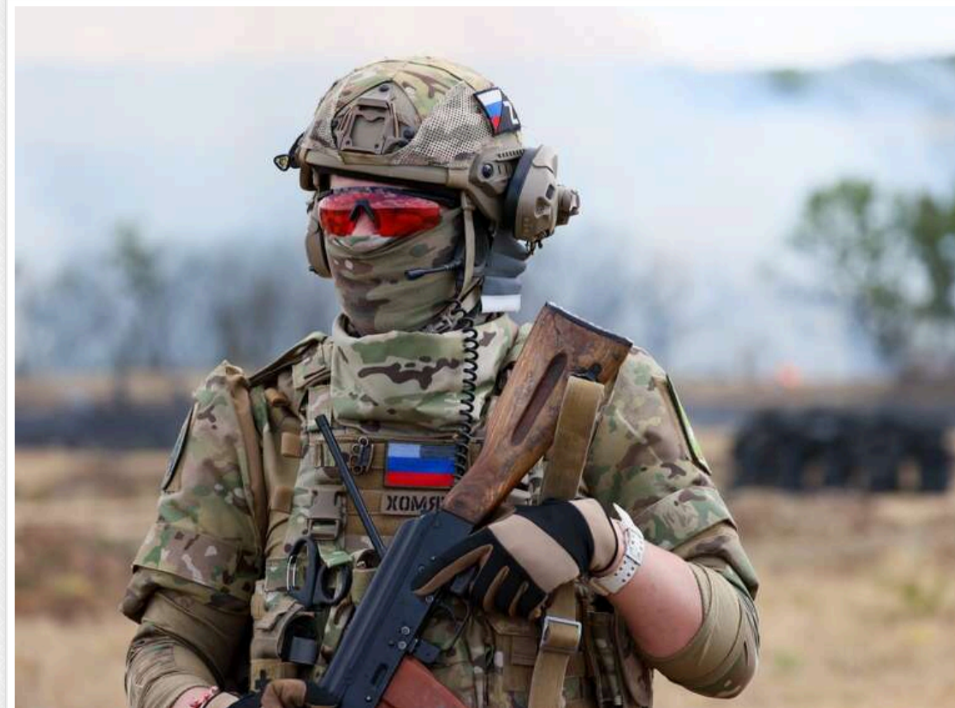
Бої за Костянтинівку: український військовий заявив про просування росіян і загрозу для оборони міста

“Оборона може почати сипатися”. Український військовий з позивним “Мучний” повідомляє, що російські сили вже відзначаються по всій Костянтинівці, застосовуючи ту ж схему, що й при наступі на Покровськ.