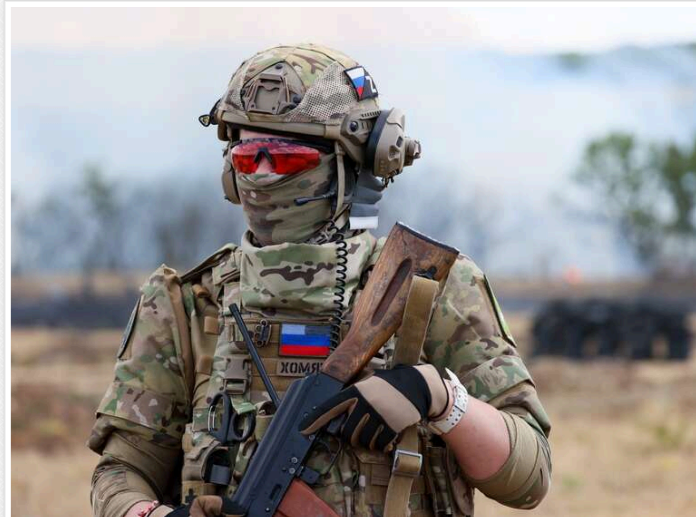
Бої за Костянтинівку: український військовий заявив про просування росіян і загрозу для оборони міста

Читати на руском Read in English Додати як бажане джерело в Google