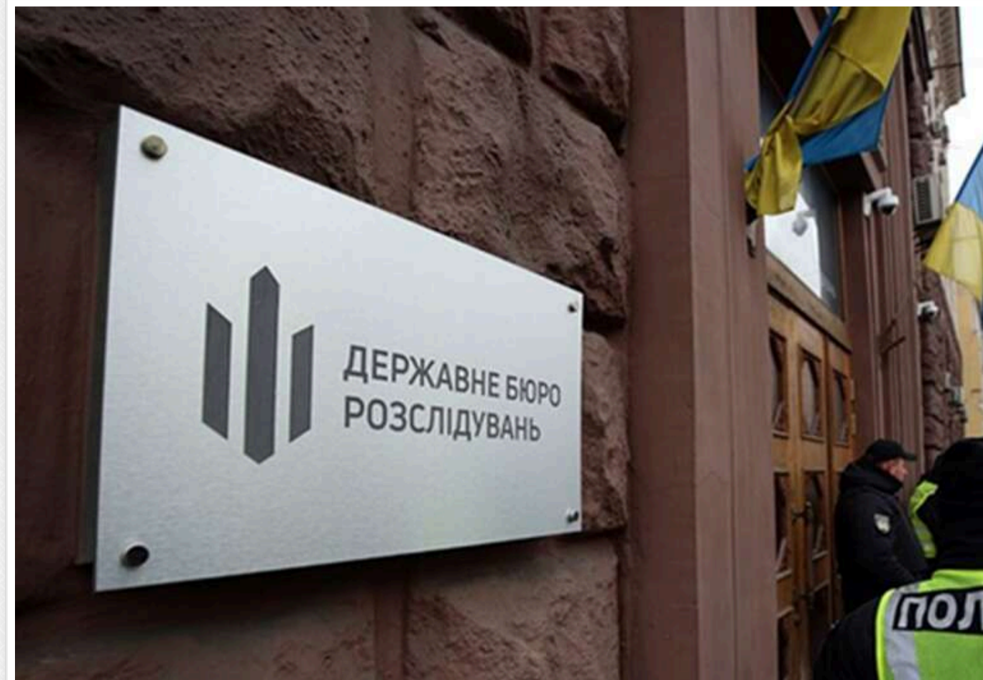
Привласнили елітні квартири на мільйони гривень: у Києві судитимуть адвокатку за участь у шахрайській схемі

Правоохоронці України передали до суду обвинувальний акт стосовно адвокатки, яка брала участь у злочинній схемі з незаконним заволодінням престижним житлом в Києві. Їй може загрозувати покарання у вигляді позбавлення волі строком до 12 років із конфіскацією майна.